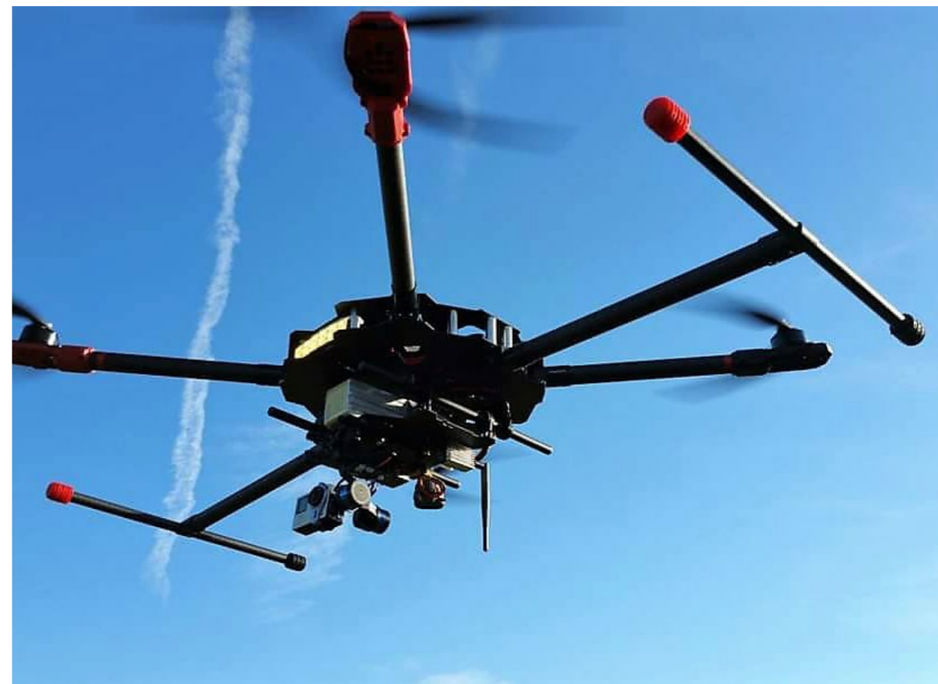
Un drone per riprese audio-video

In sostanza, per non prendere come si suol dire "luciole per lanterne", i piloti e i comuni osservatori avvistando il movimento di alcuni oggetti -