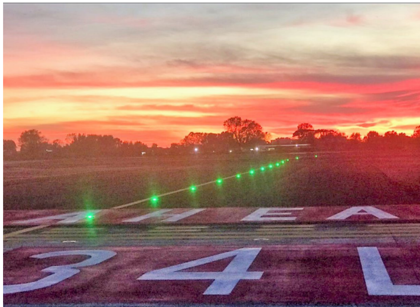
Rifrazioni di luci in pista al tramonto

costretto a effettuare deviazioni, i piloti possono essere indotti a intraprendere azioni evasive. In sostanza il fascio di luce intenso e concentrato che colpisce la cabina dell'aereo genera in primo luogo potenziali problemi di sicurezza, compromettendo la vista dei piloti nelle fasi delicate del viaggio in cui è richiesta la massima concentrazione. Oltre ai puntatori laser la navigazione aerea può incappare anche nei "laser show" - spettacoli che irradiano nel cielo la proiezione grafica di fasci intensi di luce, di un solo colore o multicolore, in grado di improvvisare anche un'accecante Aurora Boreale - oppure nei più classici fuochi pirotecnici. Situazioni che possono pregiudicare a caduta la sicurezza del velivolo e del prossimo incoming di traffico aereo (gestito dalla Torre di Controllo); oltre al fatto che l'esposizione diretta dell'uomo ai raggi laser può anche causare danni alla retina. In caso l'evento accada, è segnalato dal pilota al controllore del traffico aereo che lo trasmette alle Forze dell'Ordine. Quest'ultime intervengono nella zona indicata con l'intento d'identificare e applicare i provvedimenti previsti dalla legge ai disturbatori.