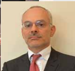
Gianluca Littarru, Direttore Generale del Gruppo ADR

di Gianluca Littarru Direttore Generale del Gruppo ADR