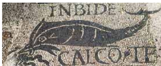
Mosaico posto all'ingresso del mercato del pesce con la scritta: "Invidioso, ti calpesto"

L'emozione che si vive visitando Ostia Antica è