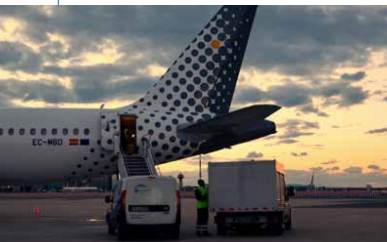
Momenti di lavoro in aeroporto

“L'aeroporto costituisce un attore importante e ADR ha già fatto molto in questo ambito, sia con l'ampliamento delle infrastrutture a servizio dei passeggeri, sia con la crescita consistente della qualità dei servizi. Inoltre la società di gestione è partner del 'Convention Bureau di Roma e Lazio', organizzazione il cui obiettivo è sviluppare il segmento MICE, fornendo un supporto allo sviluppo del turismo internazionale. Tuttavia molto ancora si può mettere in campo per questo obiettivo. Penso che il nostro 'Sistema Paese' possa fare meglio di quanto stia già facendo oggi nell'attrarre il turismo di qualità con alcune rare eccezioni. La città di Roma, al momento, non sta sfruttando tutte le opportunità che avrebbe anche se alcune catene alberghiere di fascia alta hanno realizzato importanti investimenti.