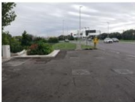
Figura 1 - ambito accesso PV ENI 59337