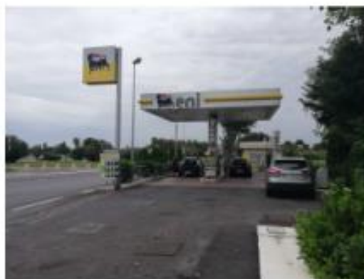
Figura 2 - Vista di insieme dell'area di impianto