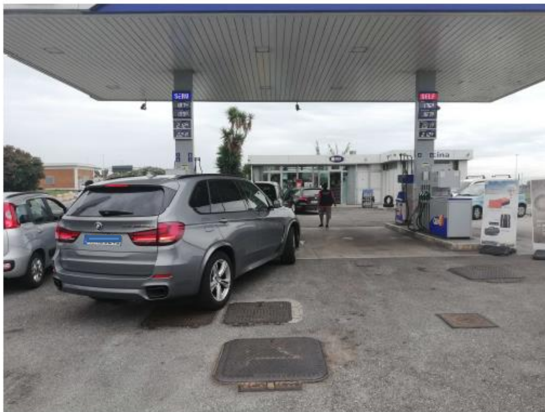
Figura 1 vista pensilina e shop