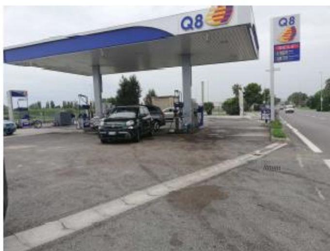
Figura 2 Vista Pensilina