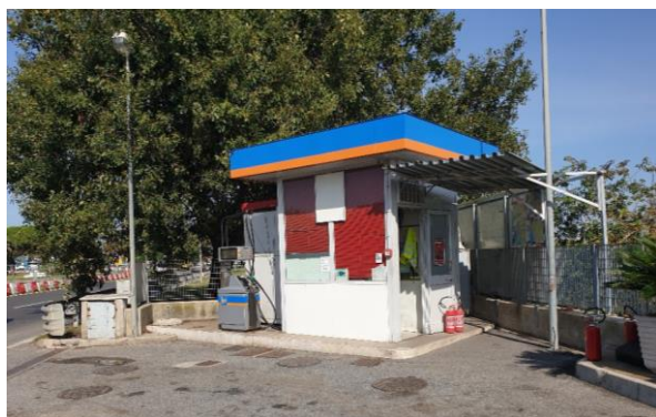
Figura 1- Chiosco ed erogatore fuori uso