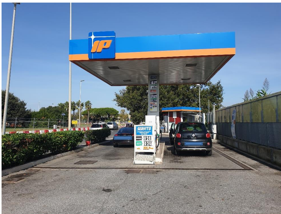
Figura 3 – Vista pensilina