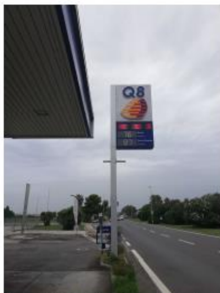
Figura 1 Vista Pensilina e accesso dalla sezione stradale