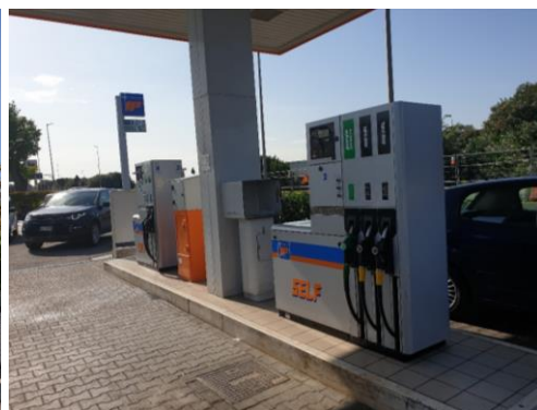
Figura 2- erogatori bifronte multidispenser