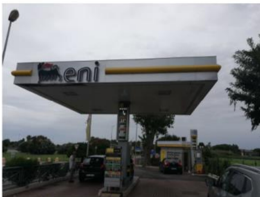
Figura 1 - vista statu manutentivo pensilina